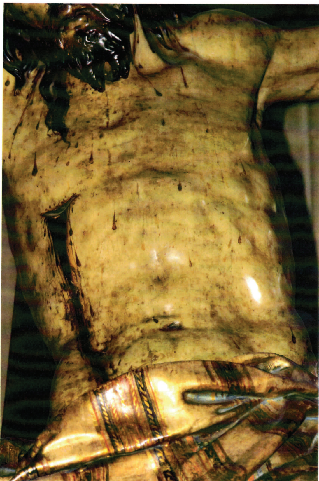
Detalle del estado de conservación en las carnaciones del tronco.