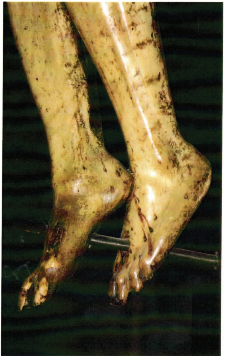
Detalle de ambos pies, vistas frontal y lateral.